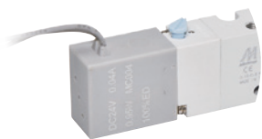
● (W) 出線型