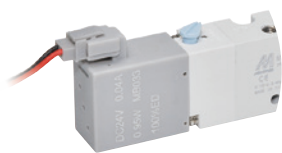
● (H) 水平插座附燈型