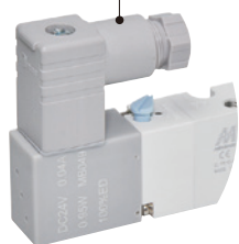
● (D) DIN 端子型