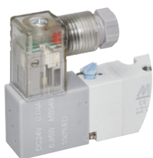
● (L) DIN 端子附燈型